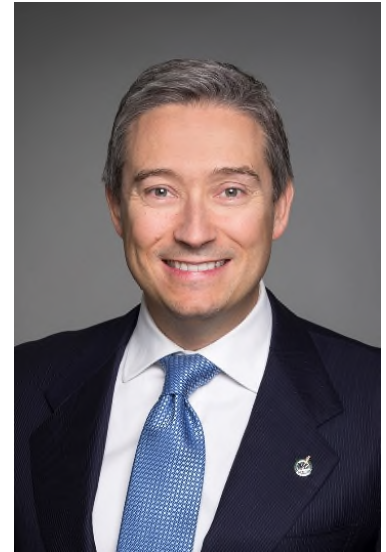
L'honorable François-Philippe Champagne

Dans cette optique, j'ai le plaisir de présenter le Plan ministériel 2023-2024 du CRSNG.