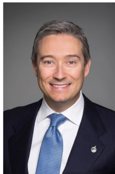
L'honorable François-Philippe Champagne

Nous vous invitons à lire le présent rapport pour en savoir davantage sur la façon dont les organismes du portefeuille d’ISDE collaborent avec les Canadiens et les Canadiennes de tous les horizons et de toutes les régions, urbaines et rurales, pour faire du Canada un chef de file de l’économie mondiale.